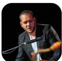
François GILBERT Régie Son